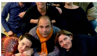
Le " Cab St-Flo " nouveau de l'humour à tout prix