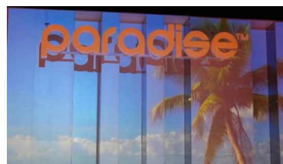
" Le paradis des autres " de Carna se dévoile