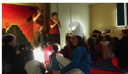
Rythme et douceur au centre de loisirs